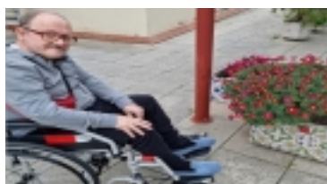
Flors de colors.