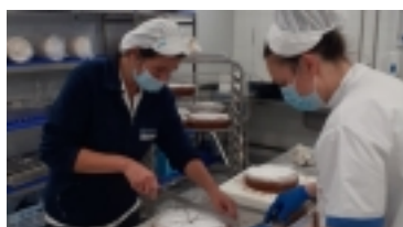
Equip de Restauració en procés d'elaboració