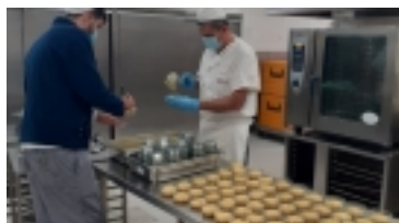
Crema Catalana de Sant Josep